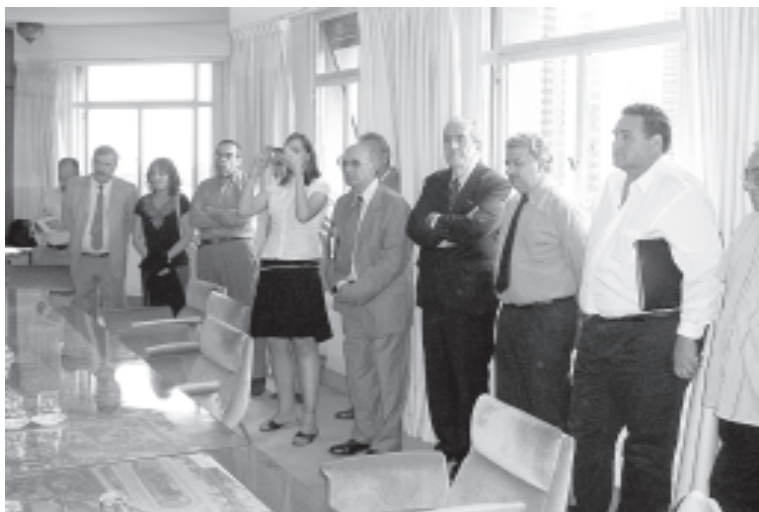
Vecinos de Villa Pueyrredón invitados a la firma del convenio

La obra de apertura de calles estará a cargo de la empresa Eleprint S.A., concesionaria de la zona 10 del sistema de gestión vial. En cuanto a la construcción de las veredas, la empresa saldrá de la licitación pública que, al igual que en el Contrato de Gestión Vial, dividirá en 12 zonas a la ciudad. Se calcula que para el mes de abril estarán adjudicadas cada una de ellas.